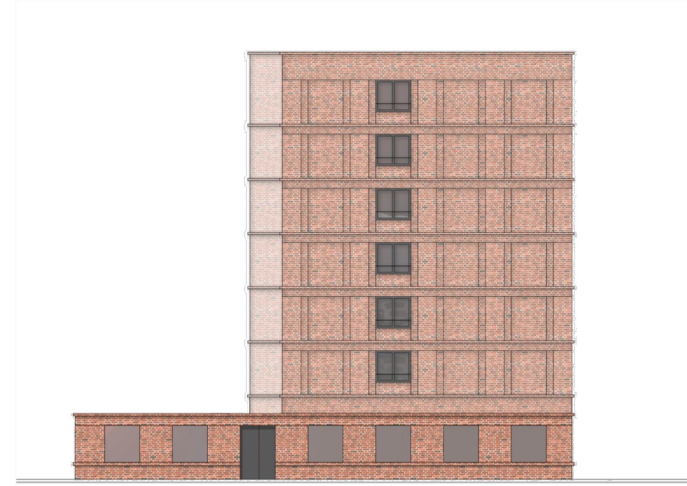
Ansicht Südwest (Universitätsbibliothek)