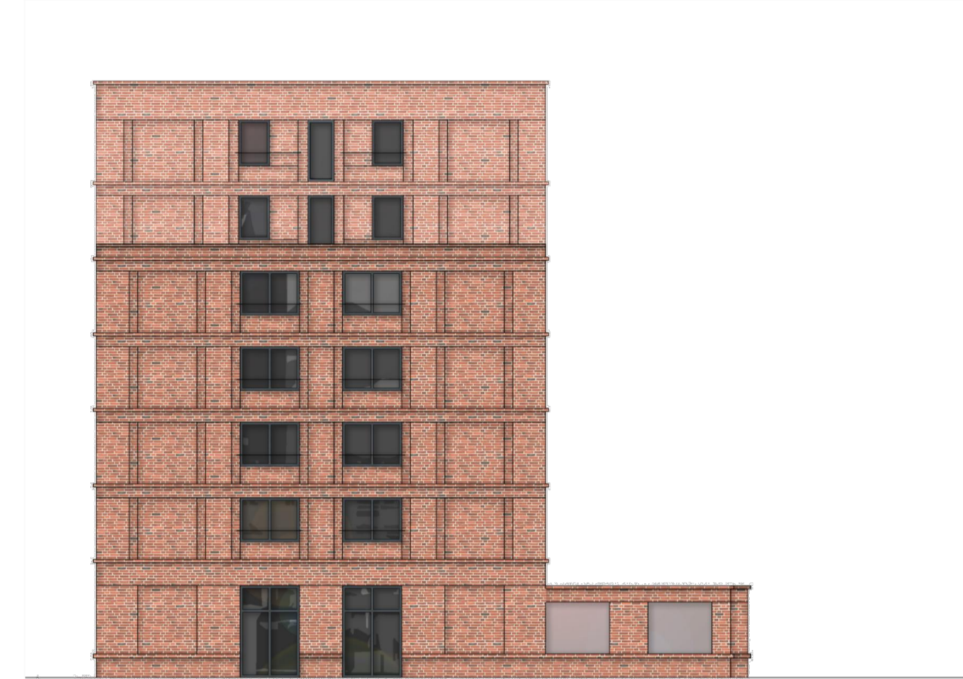
Ansicht Nordost (Verlängerung Am Taubenfelde)