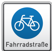
Beginn der Fahrradstraße