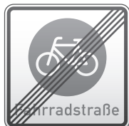
Ende der Fahrradstraße