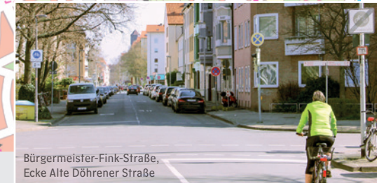
Bürgermeister-Fink-Straße, Ecke Alte Döhrener Straße